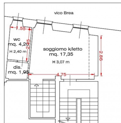
PIANTA PIANO PRIMO/AMEZZATO