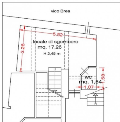
PIANTA PIANO TERRENO